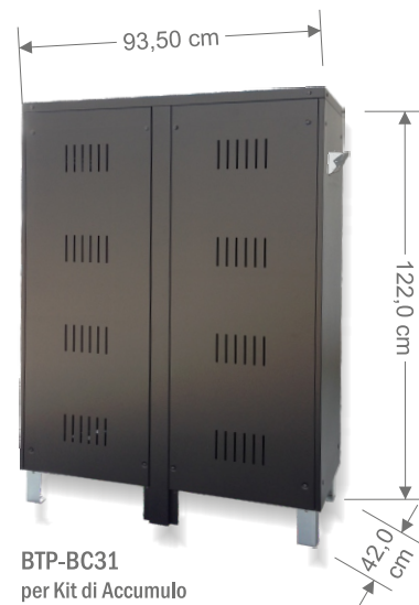
BTP-BC31 per Kit di Accumulo al Pb da 4.0 a 8.0kWh