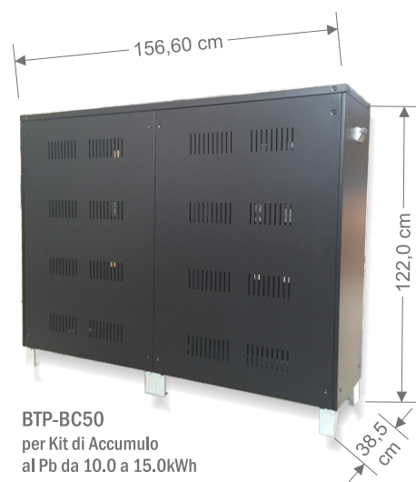
BTP-BC50 per Kit di Accumulo al Pb da 10.0 a 15.0kWh